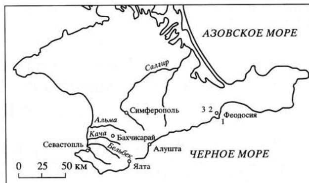
Рис. 1. Схема расположения изученных разрезов: 1 — мыс Святого Ильи, 2 — поселок Султановка, 3 — п. Наниково, Баракольская долина.

Ретовский (Retowski, 1893) из феодосийского разреза берриаса описал своеобразную группу аммонитов, характеризующуюся сглаживанием скульптуры на жилой камере, припупковыми и боковыми бугорками ( Hoplites calisto var. kaffae , H. calisto var. berthei , H. calisto var. delphinensis , H. janus , H. obtusenedosus , H. consanguineus , H. subchaperi ). В дальнейшем г. Мазено (Mazenot, 1939) из берриаса Франции описал аммонитов, которых объединил в группу Berriasella delphinensis ( B. delphinensis , B. garnieri , B. aff. janus , B. sp. ind. , B. moravica , B. obtusenedosa , B. aff. obtusenedosa , B. alpillensis ). Как отметил Мазено (там же, с. 67), “эта группа охватывает берриаселл малого или среднего роста, плоской формы, у которых ребристая скульптура ... претерпевает на жилой камере сглаживание, начинающееся с наружной трети боков и постепенно распространяющееся более