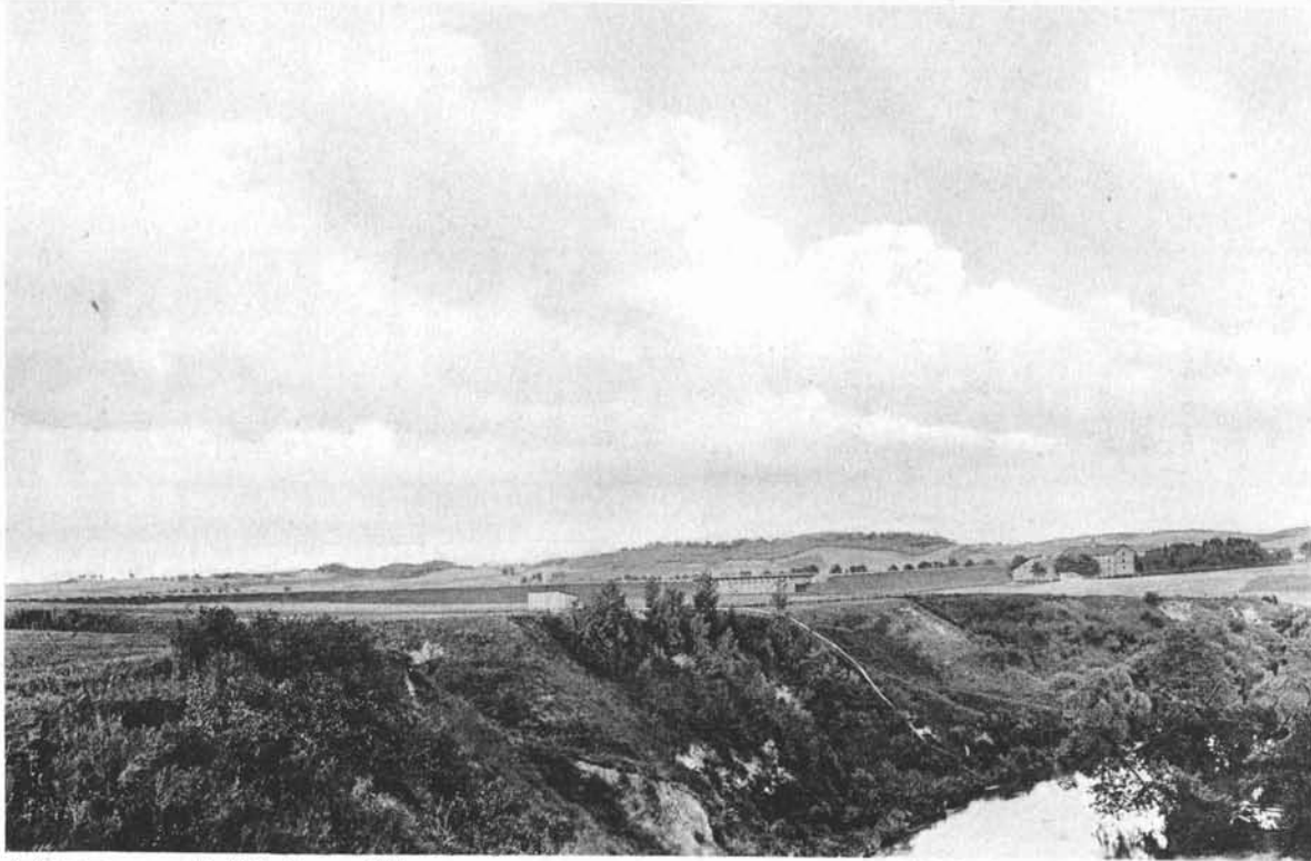
1901.