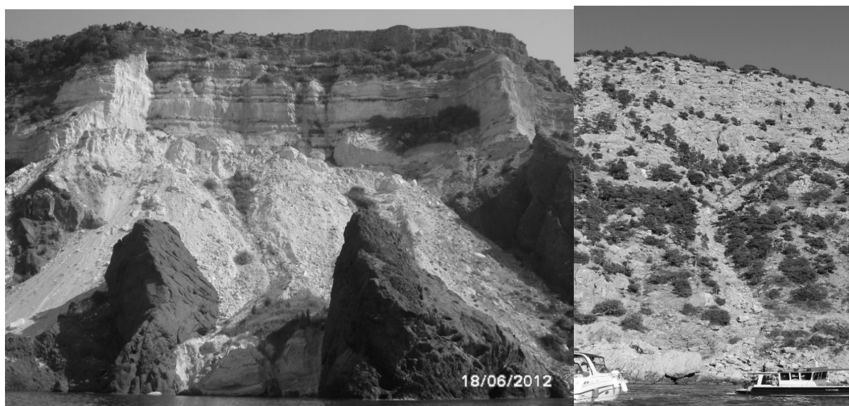
Рис. 4. «Висячие» осыпи под обрывами в районе м. Фиолент (слева) и у м. Айя (справа) (Фото авторов)

Обвалы, осыпи и камнепады. У м. Фиолент, под плато Кая-Баш и Караньским, от урочища Аязьма до м. Айя широко развиты обвально-осыпные процессы и камнепады (рис. 4). Так, у бровки Караньского плато, рассеянного во всех направлениях тектоническими нарушениями, образуются крупные обвалоопасные блоки. Объемы их разовых обрушений достигают 20,0–80,0 м 3 (Опасные обрушения..., 2013).