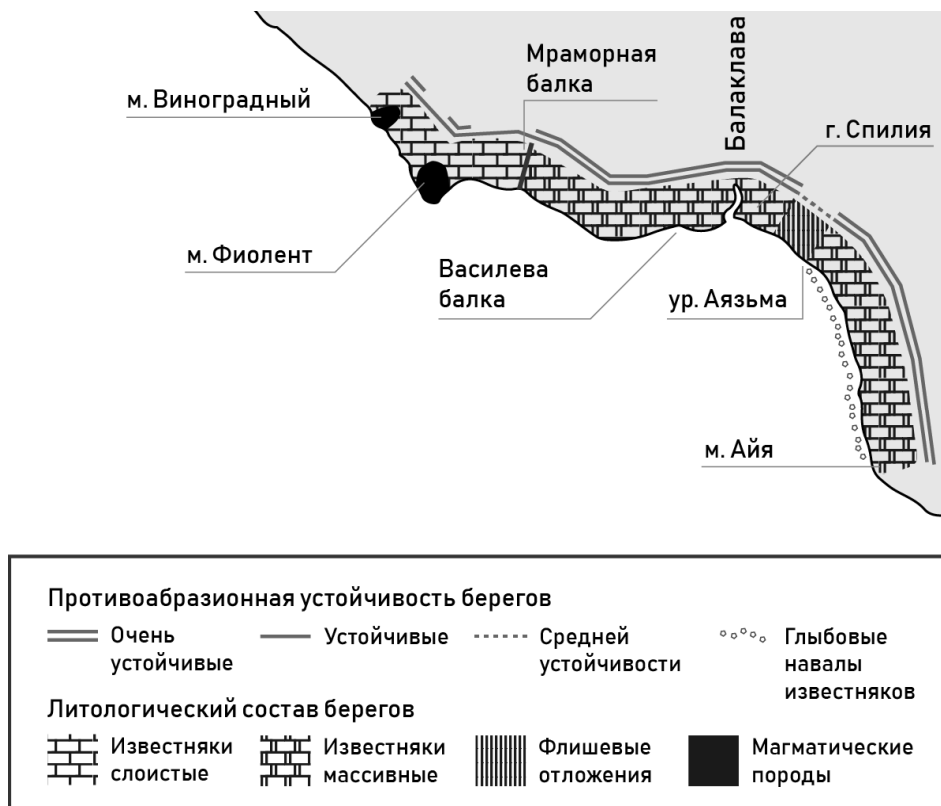
Рис. 1. Литологический состав и противоабразионная устойчивость берегов

средней устойчивости к абразии (Агаркова-Лях, 2006). По этому показателю берега между м. Виноградный и м. Айя отнесены, преимущественно, к категории очень устойчивых и объединены в единый участок. Их отличительной особенностью является высокая прочность, благодаря чему берега почти не абрадируются. Первые выходы изверженных вулканических пород – кварцевых кератофиров начинаются у м. Виноградный и представлены мысами (Виноградный, Броневой, Лермонтова, Сфинкс (Львенок), Фиолент и др.), скалами-островками (Орест, Пилад, Святого Явления (Георгиевская) и др.) и береговыми скалами (Крестовая (Монах) и др.) (рис. 2). В двух километрах к востоку от м. Фиолент вулканические породы исчезают, а береговой обрыв пререзает Мраморная балка, проходящая по линии тектонического сброса, отделяющего слоистые сарматские известняки от массивных верхнеюрских мраморизованных. Последние тянутся с некоторыми перерывами почти до м. Айя, моделируя форму берегов. От урочища Аязьма до м. Айя на берегу развиты глыбовые навалы известняков, исчезающие на обрывистых участках.