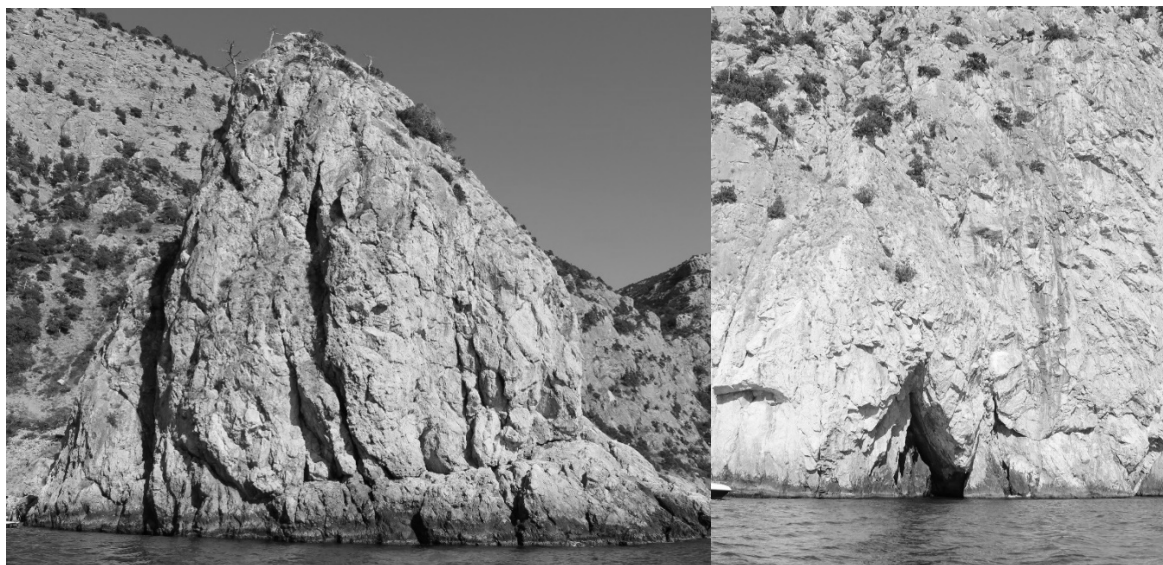
Рис. 3. Скала Второй Шпиталь близ м. Айя (слева). Вход в грот под м. Айя (справа)

У м. Фиолент встречаются отдельно стоящие в море скалы (Орест, Пилад и пр.) призматической островерхой формы высотой до 30,0 м (Попов, Лисицкая, Поспелова, 2014), которые являются результатом селективной абразии берегов. Они располагаются в 25,0–40,0 м от берега и называются кекуры (рис. 2, справа). Скалы у берегов урочища Аязьма (Первый и Второй Шпитали (Паруса или Зубы)), по-видимому, имеют обвально-оползневое происхождение (рис. 3).