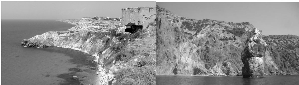
Рис. 2. Вид с юга на «разлапистый» м. Виноградный из магматических пород (слева). Скала Пилад у м. Фиолент (справа)