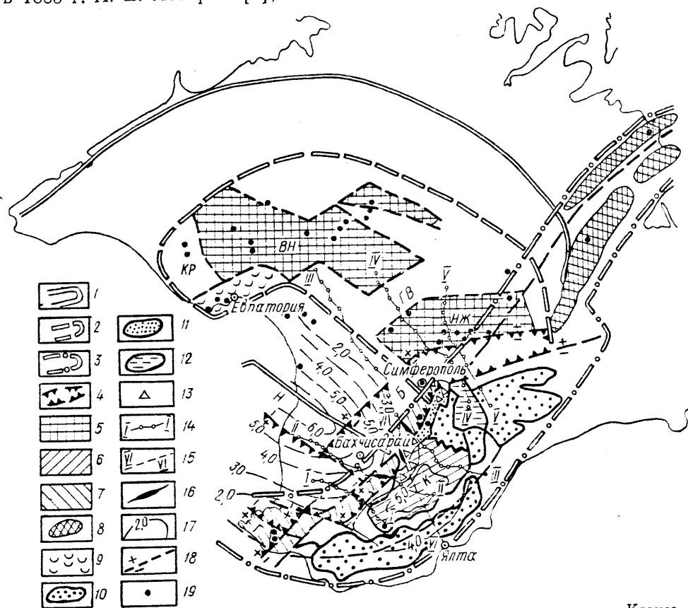
Рис. 1. Схема расположения основных докембрийских складчатых структур Крыма и тектонического положения верхнепалеозойских глыб

мента Гераклеийским блоком. В его пределах вблизи крупного Георгиевского разлома скв. 48, 62 под альбскими песчаниками на небольшой глубине (44—134 м) открыты верхнепалеозойские гранит-порфиры, изотопный возраст которых составляет 325 млн. лет [3]. Несколько восточнее, к северу от г. Балаклава установлены граниты, впервые обнаруженные в 1885 г. А. Е. Лагорно [7], а затем описанные В. В. Аршиновым [2],