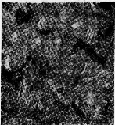
Рис. 1. Вулканічний туф з с. Констанція. \times 20 .

На лівобережжі р. Дністра, між його притоками Нічлавою і Серетом, недалеко від с. Констанція, однією з свердловин в надгіпсових відкладах був виявлений проверсток карбонатної породи, яка зовні дуже нагадує собою пісковик. При макроскопічному описі цю породу визна-