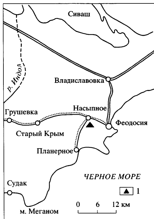
Рис. 1. Схема расположения изученного разреза. 1 – Насыпкойский разрез.