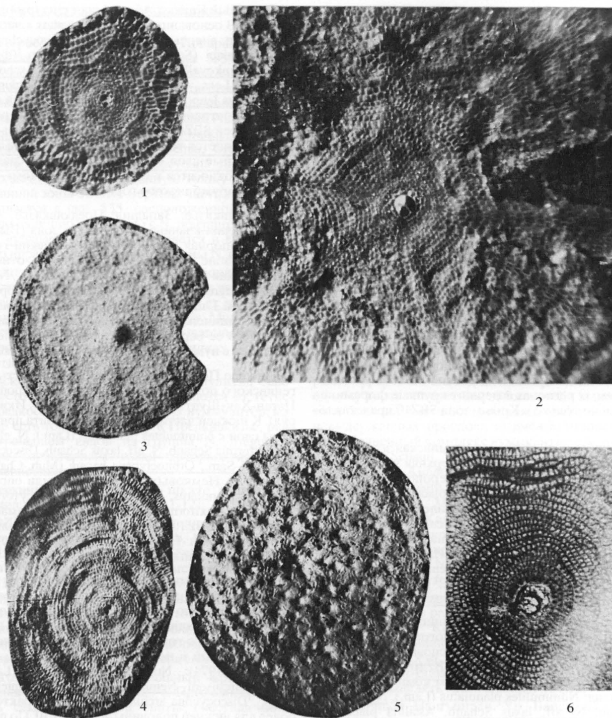
Фототаблица. Ортофрагминиды из новых местонахождений Северо-Восточного Перитетиса.

1–5 – Северный Устюрт, скв. 354, обр. 354/456: 1 – Nemkovella strophiolata bodrakensis Less, \times 35 ; 2 – Asterocyclina rara Zakr., \times 35 ; 3, 4 – Discocyclina trabayensis trabayensis Neum.: 3 – \times 10 , 4 – \times 20 ; 5 – Discocyclina granulosa (Port.), \times 20 . 6 – Discocyclina furoni Sam., Северный Кавказ, р. Фарс, обр. 4509a, \times 35 .