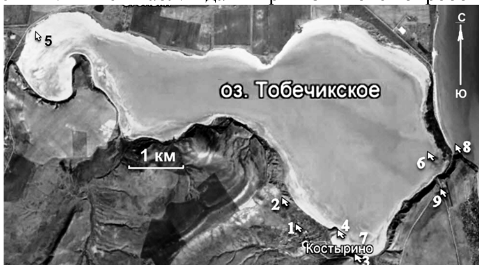
Рис. 1. Расположение точек опробования

На рисунке 1 представлена схема полевых опробований за 2013-2014 гг. Ниже в табл. 1 даны привязки точек опробования.