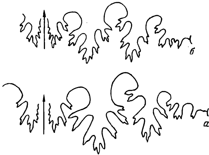
Рис. 3. Лопастные линии Arctophyllites okhotensis sp. nov.; а — голотип № 10/984 при D = 51,6 мм, B = 22,3 мм, Ш = 16 мм; б. Вторая Сентябрьская; верхний карний, зона Neosirenites pentastichus ; б — экз. № 13/984 при D = 48 мм, B = 22,5 мм, Ш = 16,9 мм; местонахождение то же; верхний карний, зона Sirenites yakutensis

зонам omkutchanicum и seimkanense современной стратиграфической схемы [5]. Однако в списках аммоноидей из зоны nelgechense отсутствует Discophyllites porovi и здесь Архиповым определены только Discophyllites taimyrensis и формы, близкие к этому виду. В комплексе аммоноидей вышележащей зоны Neosirenites irregularis , отвечающей верхнему карнию, Архиповым приведены только Discophyllites sp. и D. ex gr. taimyrensis .