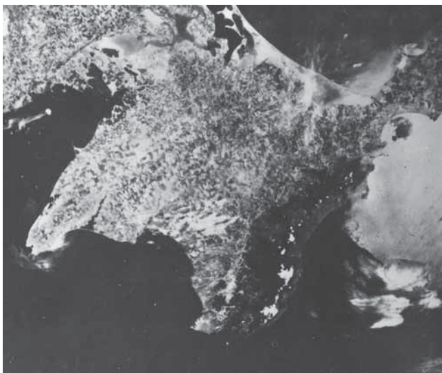
Рис. 1. Космический снимок Крымского полуострова, сделанный с орбитальной станции «Салют-4»

С конца 70-х – начала 80-х гг. прошлого века в тектонике Крыма, в том числе Равнинного, некоторые исследователи (Казанцев, 1982; Юдин, 1994, 2011 и др.) большое значение стали придавать горизонтальным движениям и созданным ими структурам. Однако многие исследователи считают необоснованным выделение в Крыму многочисленных надвигов, взбросов, сутур и прочих тектонических нарушений (Борисенко..., 1997 и др.). Представления школы геологов Московского университета о геологической структуре и эволюции Крыма отражены в недавней публикации (Nikishin et al., 2015). Так что этот вопрос остается дискусс-