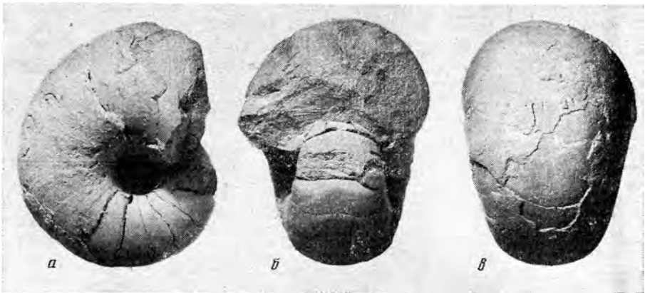
Рис. 3. Germanonautilus ljubovae Schastlivtceva, sp. nov.; голотип № 1473/10 ( \times 0,6 ): а — латеральная сторона, б — со стороны устья, в — вентральная сторона; Восточный Таймыр; средний триас

Описание. Форма (рис. 3). Раковина полуинволютная с быстро возрастающими в высоту и ширину оборотами. Поперечное сечение оборота на ранних стадиях онтогенеза трапециевидное, на более поздних — почти полукруглое. Ширина первых двух оборотов вдвое превышает высоту