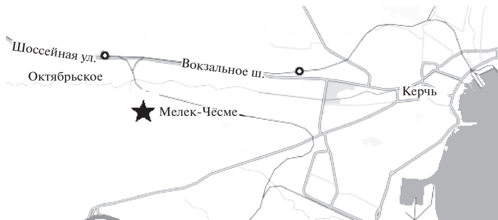
Рис. 1. Местонахождение Мелек-Чесме.